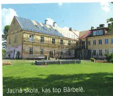
Jaunā skola, kas top Bārbelē.

– Esmu dzirdējus stāstu, ka jums šis attiecības pa īstam sākās, karojot Afganistānā. Uz dzīvības un nāves robežas.