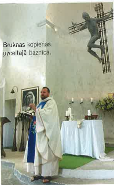
Bruknas kopienas uzceltajā baznīcā.

– Ne gluži. Mamma bija ticīga, tētis nenoliedza, bet uztvēra to citādi. Viņa mīlestībā varēja atpazīt attiecības ar Dievu, un tas bija kas ļoti veselīgs. Tēvs prata mīlēt bez ārējām formām, un varbūt tāpēc arī man tik svarīga nelielas stingri ortodoksāla garīgā dzīve, lai arī tas daļu kaitina. Man galvenais, lai reliģiozitāte nav butaforija. Lai neklūstam par tādiem dīvāna kristiešiem, kas spēj mainīties ar skaistām reliģiskām vēsmām, bet pat neuzdrīkstamies ne pajauties uz Dievu, ne viņam uzticēties. Tieši tas apdraud mūsu attiecības ar Dievu.